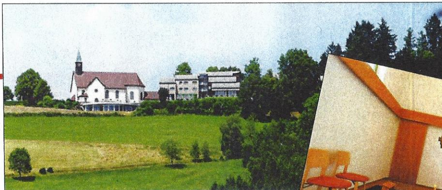
Die Wallfahrtskirche auf dem Lindenberg und das Haus Maria Lindenberg.

In der Adventszeit ruht die Männergebetswache auf dem Lindenberg bei St. Peter. Bereits zum dritten Mal hat sich währenddessen eine kleine Gemeinschaft der Kontemplationsschule via integralis dort eingefunden. Frauen und Männer, die sich vor einigen Jahren angesichts der Flüchtlingswelle von der Männergebetswache inspirieren ließen und 2016 ein Jahr lang in einem Haus in der Schweiz täglich in den Anliegen „Für eine friedliche Welt“ meditierten. Nachbarn und Gäste waren der morgendlichen und abendlichen Einladung, sich mit einzubringen ebenso gefolgt wie Menschen, die für einige Tage, zum sogenannten Einzelretreat, das Haus bewohnten. Zusammen mit der kleinen Gemeinschaft verbrachten sie die Zeit überwiegend im Schweigen, sprachen über Schriftworte und Impulse christ-